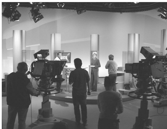
ภาพที่ 7 ผู้กำกับรายการชี้แจงการซ้อมก่อนการบันทึกรายการ

แก้ไขข้อบกพร่องหรือข้อผิดพลาดที่เกิดขึ้นได้เลย ส่วนการผลิตรายการแบบบันทึกล่วงหน้าก็เพื่อเป็นการความถูกต้อง คุณภาพและความสมบูรณ์ เพราะสามารถเสริมรายละเอียดต่าง ๆ ในรายการได้ เช่น กราฟิก เสียงเพลง เสียงประกอบ หรือการสร้างเทคนิคพิเศษทางภาพ หรือเสียง ซึ่งจะอยู่ในขั้นหลังการถ่ายทำ