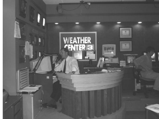
ภาพที่ 4 ห้องสตูดิโอประกาศข่าว และโต๊ะรายงานข่าวพยากรณ์อากาศ

ในส่วนของเครื่องมือ อุปกรณ์ และวัสดุในการผลิตรายการวิทยุโทรทัศน์ สิ่งที่จะขาดเสียมิได้ในการผลิตรายการวิทยุโทรทัศน์ และทำให้คงไว้ซึ่งคุณลักษณะของสื่อประเภทนี้ ก็คือ กล้องโทรทัศน์ ไมโครโฟน และเครื่องบันทึกภาพและเสียงสำหรับกรณีการผลิตรายการประเภทบันทึกไว้ล่วงหน้า นอกจากนี้ยังเป็นเครื่องมือ ประเภทแสง ซึ่งได้แก่ โคมไฟประเภทต่าง ๆ เครื่องควบคุมโคมไฟ (Light dimmer) เครื่องตรวจสอบภาพและเสียง (Video and Audio Monitor) เครื่องเลือกภาพและผสมภาพ (Video Switcher and mixer) เครื่องทำเทคนิคภาพพิเศษ (Video Effect Generator) เครื่องเล่นเทปและบันทึกภาพและเสียง (Video Recorder and Player) เครื่องเล่นวัสดุบันทึกเสียงประเภทต่าง ๆ และเครื่องผสมและทำเทคนิคทางเสียง (Audio Mixer and Audio Effect) เป็นต้น ส่วนวัสดุ ได้แก่ เทปโทรทัศน์หรือหน่วยความจำสำหรับการบันทึกรายการ บันทึกข้อมูลกราฟิก เป็นต้น ล้วนนี้มีส่วนทำให้รายการมีคุณภาพ ทั้งนี้ขึ้นอยู่กับหลักการใช้งานที่ถูกต้อง เหมาะสม และการออกแบบลักษณะสร้างภาพและเสียง