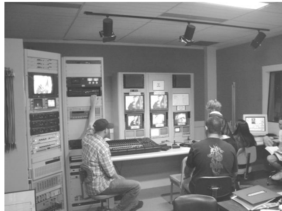
ภาพที่ 2 การฝึกปฏิบัติผลิตรายการของนักศึกษา Sacramento California University